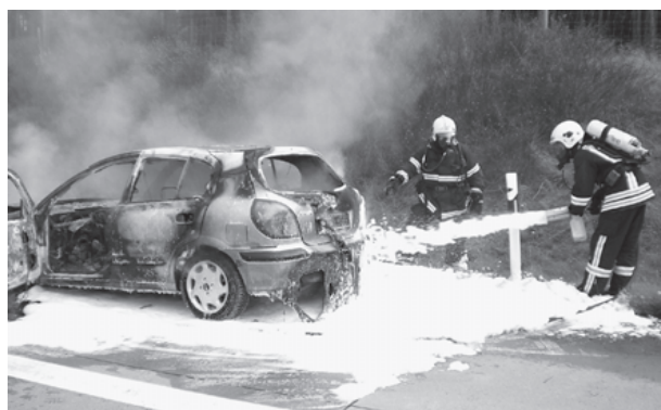
Oft wird die Feuerwehr bei Verkehrsunfällen gerufen