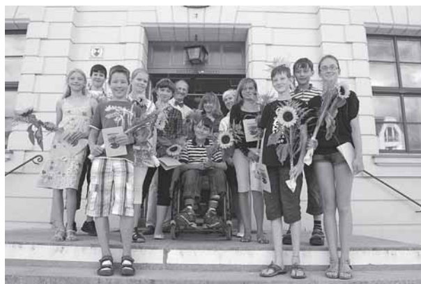
Ein schöner Start in die Ferien: Auf Vorschlag der Schulen wurden die besten und aktivsten Schülerinnen und Schüler von städtischen Schulen ausgezeichnet.

Ohne Ehrenamtler wäre unsere Gesellschaft ärmer. Ich halte es für wichtig, dass diese auch offizielle Anerkennung erhalten und möchte Sie auf einen interessanten Wettbewerb aufmerksam machen. Das „Bündnis für Demokratie und Toleranz – gegen Extremismus und Gewalt“ sucht zum 10. Mal in Folge erfolgrei-