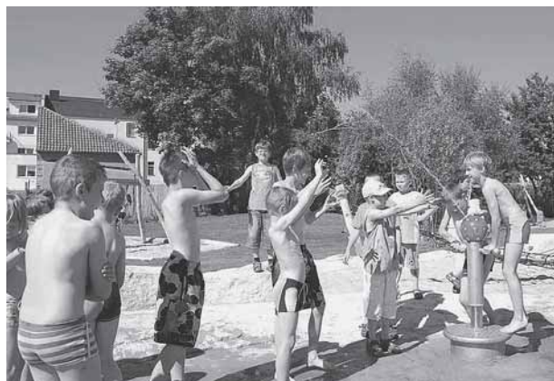
Pünktlich zu Beginn der Sommerferien nahmen Hortkinder der 3. Grundschule den neuen Wasserspielplatz in Besitz